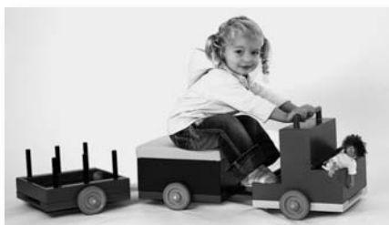
Großer Bahnhof für kleine Leute mit dem Spielzeugzug

Nach erfolgter Anmeldung erhalten Sie den Leitfaden „Sind Sie bereit?“ mit vielen Informationen und Ideen sowie einen Werbemittel-Bestellschein für Ihre erfolgreiche Veranstaltung.